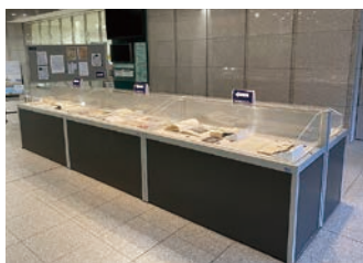
図書館前で行われた企画展示