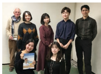
カミュ作品の朗読を終えて