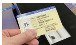
図書館へは学生証をかざして入館します。

中庭が見える閲覧席やPC設置席などがあります。グループ利用席や共同学習室もあるので、その時の学修スタイルに合わせて、利用してください。