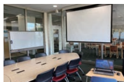
プレゼンの練習は共同学習室で!