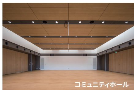
コミュニティホール