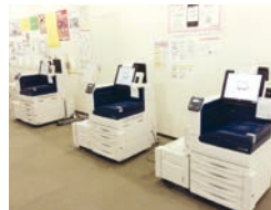
図書館のプリンタ

(または東棟4階ヘルプデスク、中央棟1階CLEAS 受付)に持参してポイントの付与を受けてください。授業期間中の総合レファレンスカウンターの受付は、平日、9時から17時まで(12:00-12:30を除く)です。無駄なプリントを控えて、資源もお金も節約しましょう。